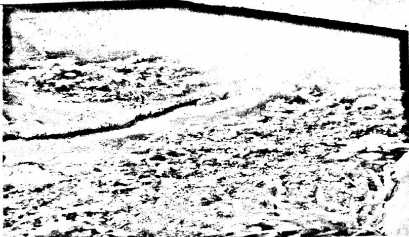
Quebrada NN o el Muerto aguas debajo del vertimiento