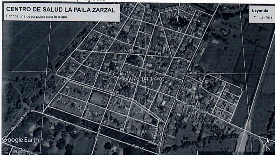
Ilustración 2. Localización del proyecto

El Centro de Salud La Paila se localiza en el corregimiento La Paila al lado sur del municipio de Zarzal, Valle del Cauca