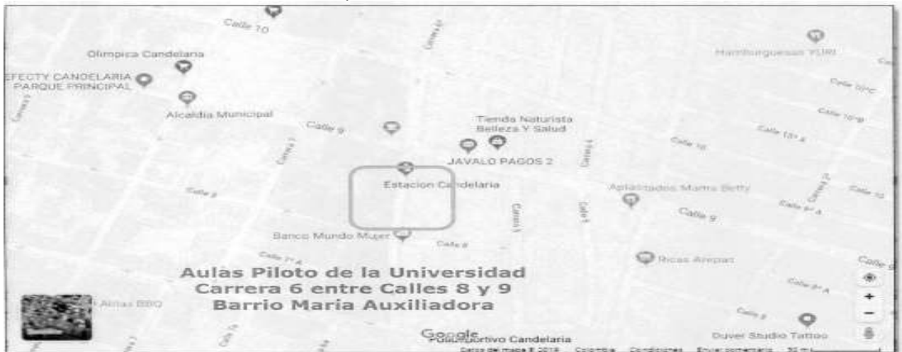
Ilustración No. 1. Localización del Municipio de Candelaria

La ubicación del proyecto se encuentra en el casco urbano, específicamente en el barrio María Auxiliadora sobre la Carrera 6 entre calles 8 y 9.