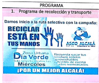
Imágenes del Día Verde