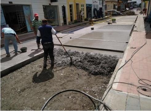
Pavimento zona centro