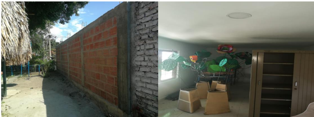
Evidencias fotográficas tomadas en el momento de la visita técnica (14 de febrero de 2019).

Los hechos expuestos tienen presunta incidencia Disciplinaria al tenor de lo estipulado en el numeral 1 del artículo 31, numeral 1 del artículo 35 y numeral 31 del artículo 48 de la Ley 734 de 2002.