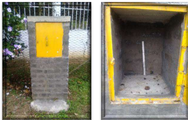
Registro fotográfico punto de muestreo vereda Alto de Tapias

Se evidencio que la administración municipal construyo los 6 puntos de muestreo que el acueducto concertó con la UES, pero se encuentran inconclusos, no se terminaron, no se le entregaron al acueducto de Acuatapias, se encuentran sin uso.