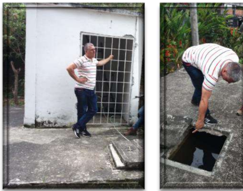
Registro fotográfico acueducto Puente Rojo

El acueducto de Puente Rojo se abastece de la quebrada Cocuyo del municipio de Ginebra. El sistema está compuesto de 2 bocatomas, 2 desarenadores, filtros y tanque de almacenamiento.