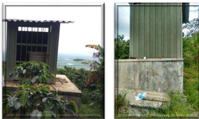
Registro fotográfico acueducto Chafalote

El acueducto de Chafalote abastece parte de la vereda La Magdalena Chafalote y La Julia.