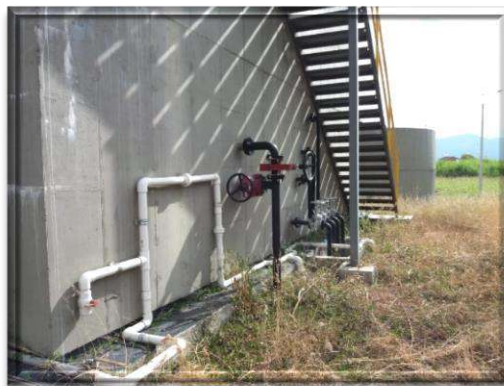
Registró fotográfico estado actual planta de tratamiento de aguas residuales de Sonso

Presentando falencias en lo establecido en el convenio interadministrativo N° 100-011-003-005, así como, lo establecido, en el artículo 209 de la Constitución Política de Colombia.