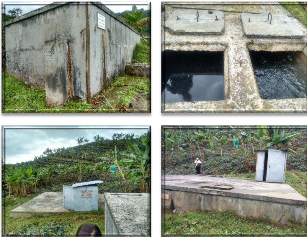
Registro fotográfico acueducto Acuatapias

Dentro de los problemas que presentan Acuatapias y que afectan la calidad del agua, se encuentran: