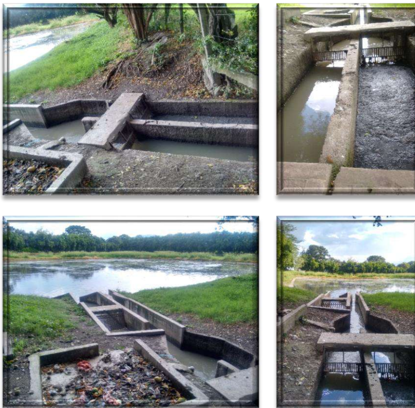
Registro fotográfico Planta de tratamiento de aguas residuales Municipio de Guacarí Valle

La planta es operada por el prestador Acuavalle S.A. E.S.P