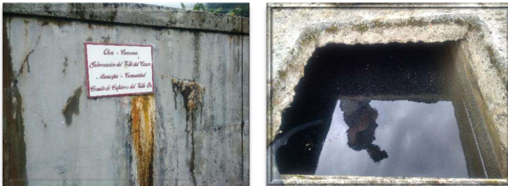
Registro fotográfico de acueductos rurales Municipio de Gucacaré Valle

Esta situación se genera por la deficiente gestión administrativa para dar solución a los problemas de calidad de agua reportados por las respectivas autoridades sanitarias. Lo que ocasiona la posibilidad de incrementar los riesgos de contraer enfermedades de origen hídrico en la comunidad.