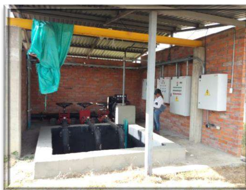
Registro fotográfico Planta de tratamiento de aguas residuales de Sonso